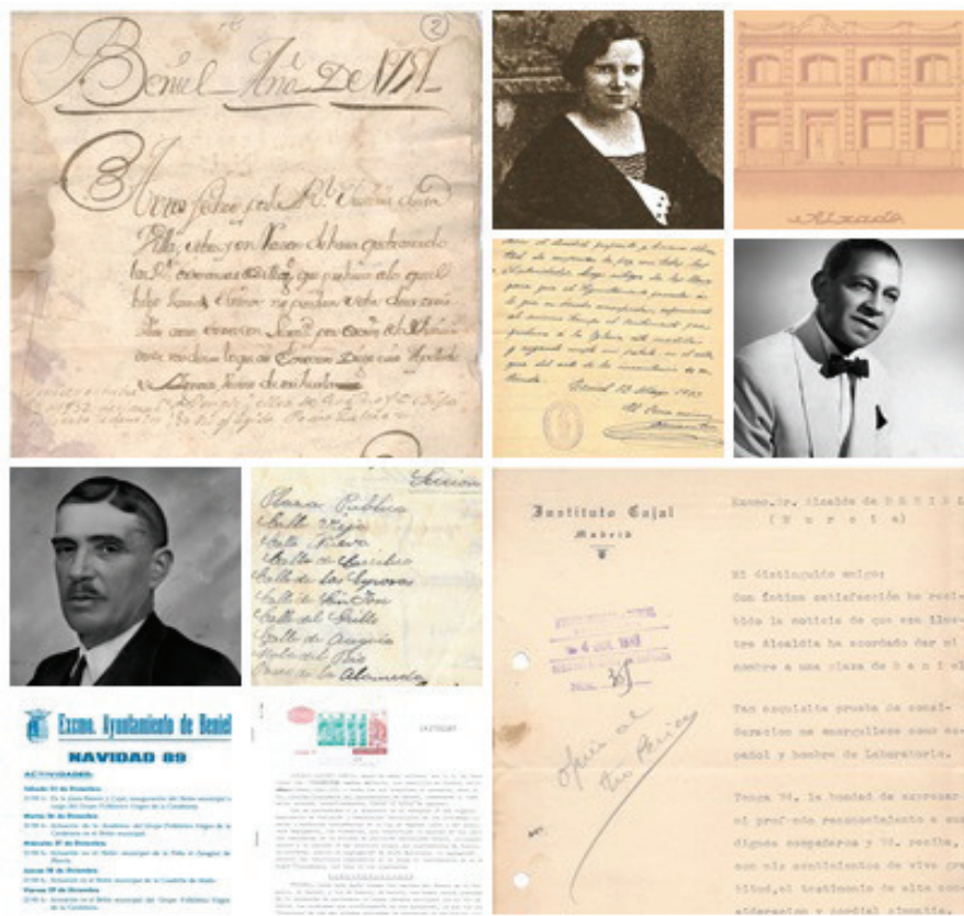
Recopilación de algunos documentos

En junio de 2018, coincidiendo con el “ Día internacional de los Archivos ” que se celebra el 9 de junio, pusimos en marcha desde el Archivo, una actuación en la que se recopilaban y se mostraban documentos curiosos del municipio, con los que dar a conocer la Historia de Beniel.