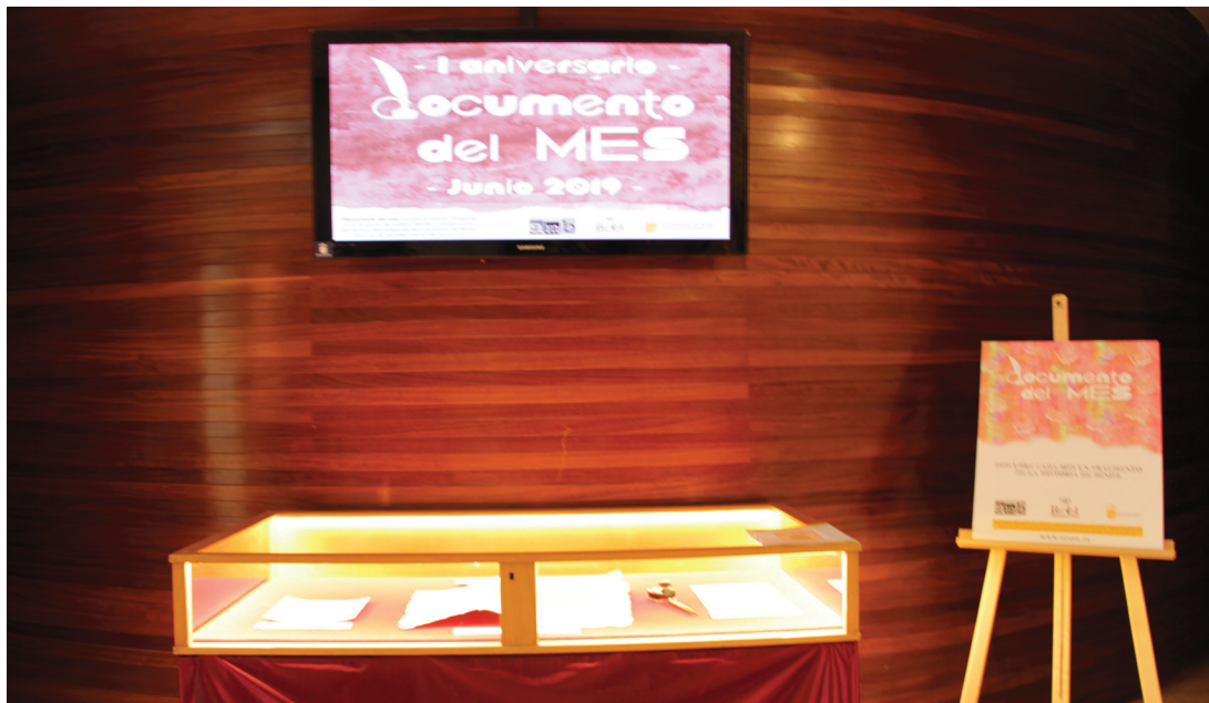
Documento del mes en la entrada del Ayuntamiento